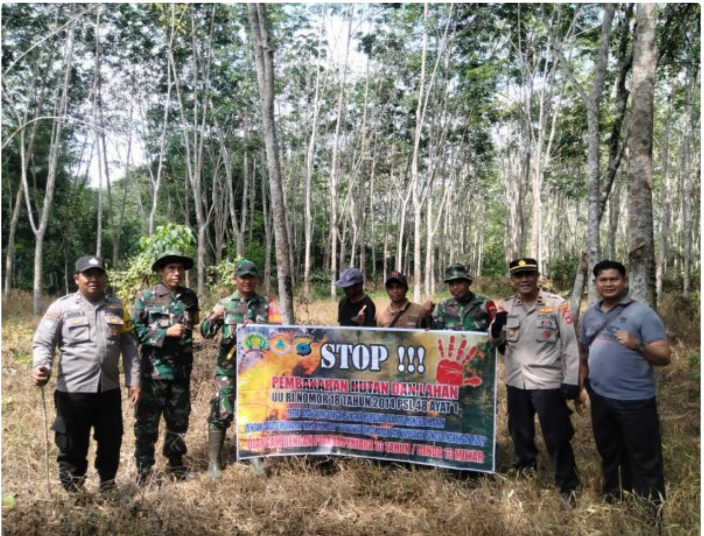
Personel Gabungan HST Lakukan Patroli dan Sosialisasi Cegah Karhutla

BARABAI-Masih maraknya hotspot dan dan terjadi kebakaran lahan, Aparat Gabungan TNI-Polri, BPBD HST, Manggala Agni, Relawan dan masyarakat melaksanakan patroli cegah karhutla.Selasa (22/08/2023).