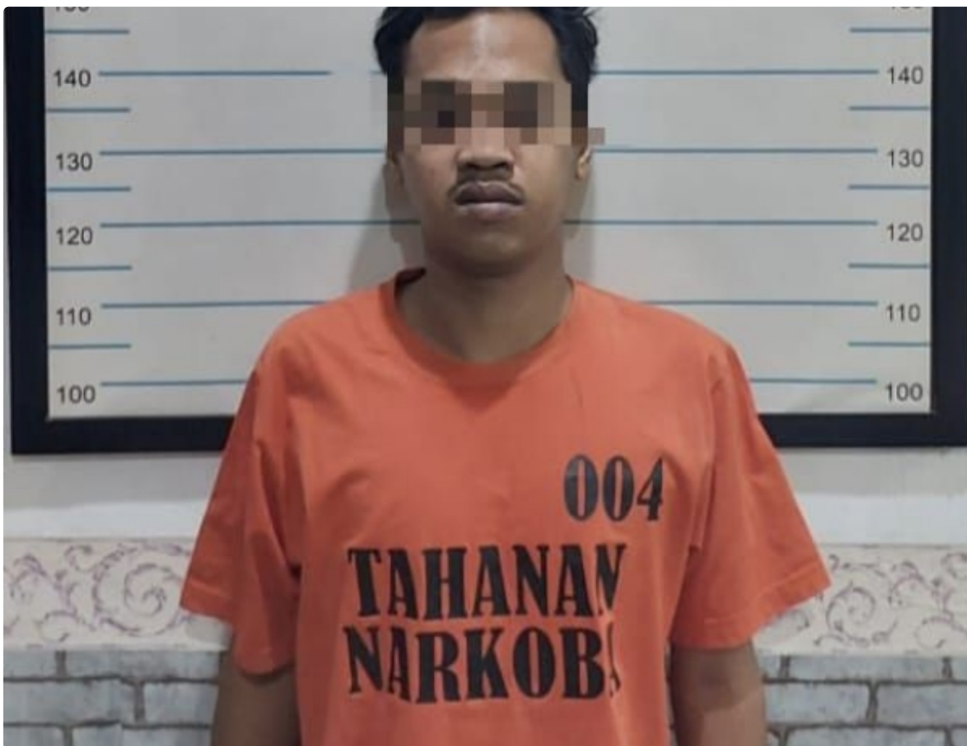
Sat Resnarkoba Polres Hulu Sungai Tengah Kembali Mengamankan Tersangka Penyalahgunaan Narkotika Jenis Sabu

BARABAI-Polres Hulu Sungai Tengah Polda Kalimantan Selatan- Satuan Resnarkoba Polres Hulu Sungai Tengah kembali berhasil mengamankan (TSK) ,